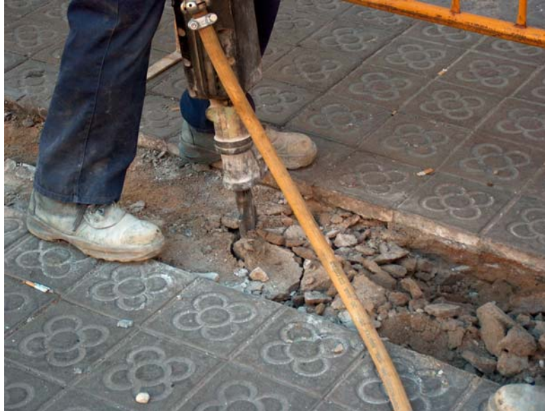
Foto1: Obertura de la rasa amb el martell pneumàtic.